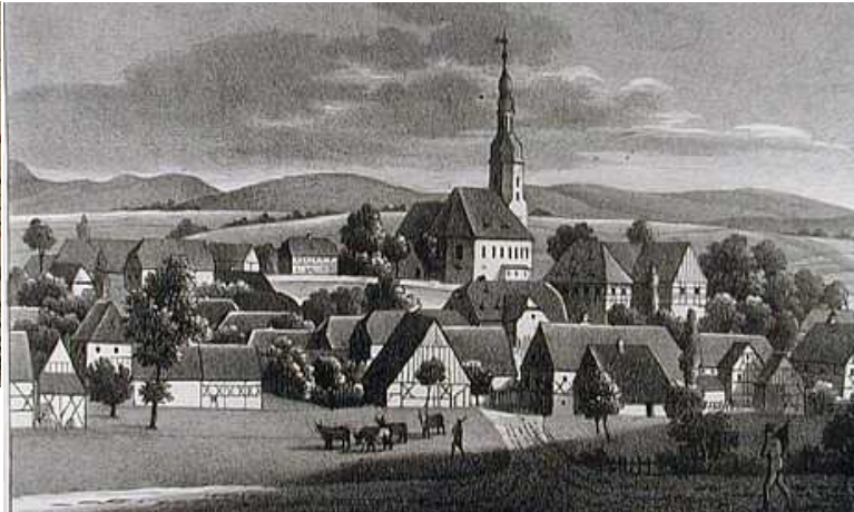
Widok od pd. –wsch. z pocz. XIX w.