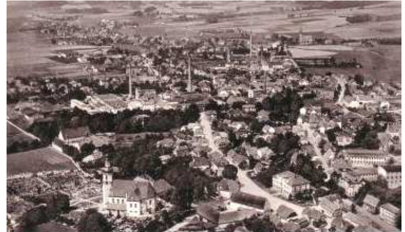
Zdjęcie lotnicze z lat 30. XX w.