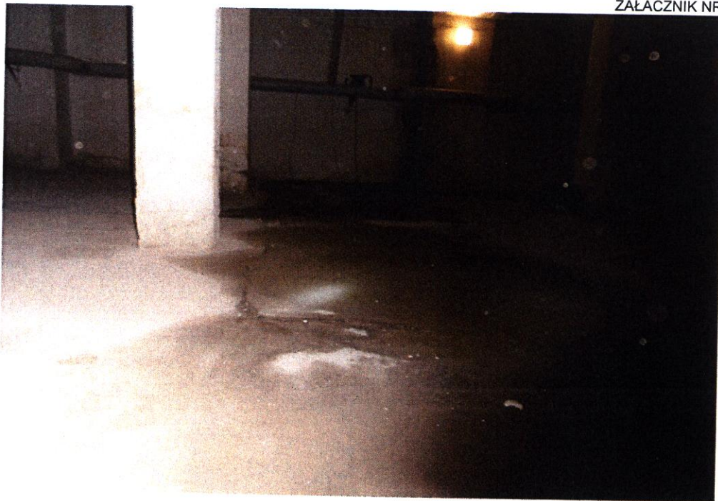
FOT. NR 01

Lokalizacja: Pomieszczenie techniczne pod basenem