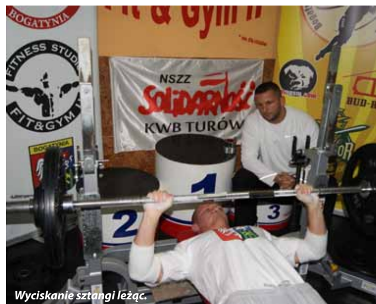
Wyciskanie sztangi leżąc.