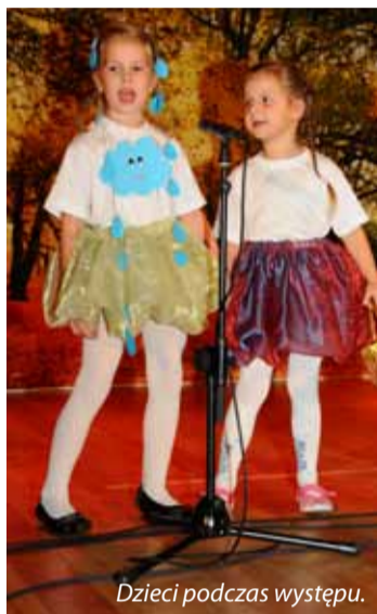
Dzieci podczas występu.