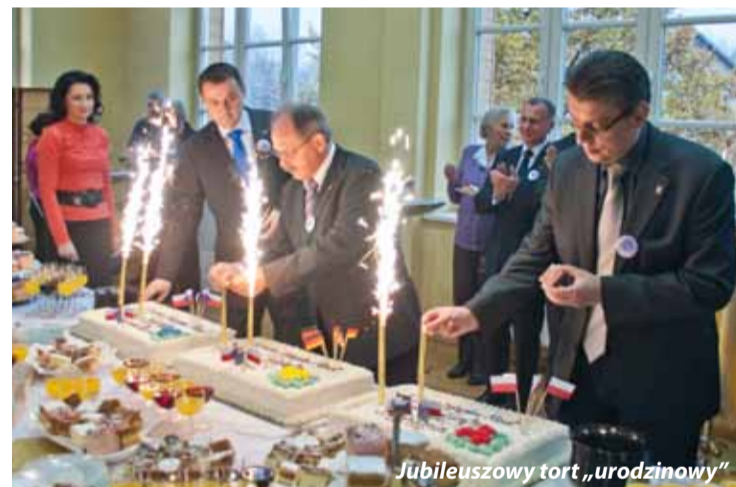
Jubileuszowy tort „urodzinowy”