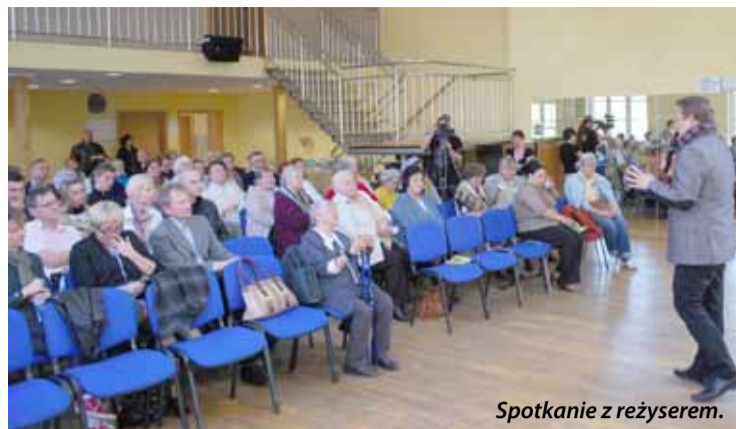
Spotkanie z reżyserem.

Jak czytamy na stronie internetowej twórcy - „film ten nie jest typowym filmem dokumentalnym. To raczej zarejestrowane w szczególnych warunkach świadectwo, manifest wiary obecnej w życiu Prezydenta