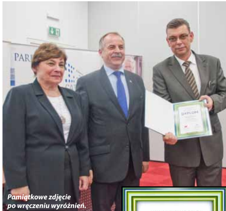
Pamiątkowe zdjęcie po wręczeniu wyróżnień.

„Ranking jest jedynym zestawieniem opierającym się wyłącznie na niezależnych danych z GUS-u, pozbawionym subiektywnych ocen osób postronnych, co czyni z niego najbardziej wiarygodne źródło na temat stanu gmin w Polsce. Cieszy mnie niezmiernie fakt, że wśród wyróżnionych w rankingu gmin znalazły się i takie, które są już Laureatami Konkursu „Teraz Polska”. Nieskromnie powiem, że potwierdza to słuszność i zasadność