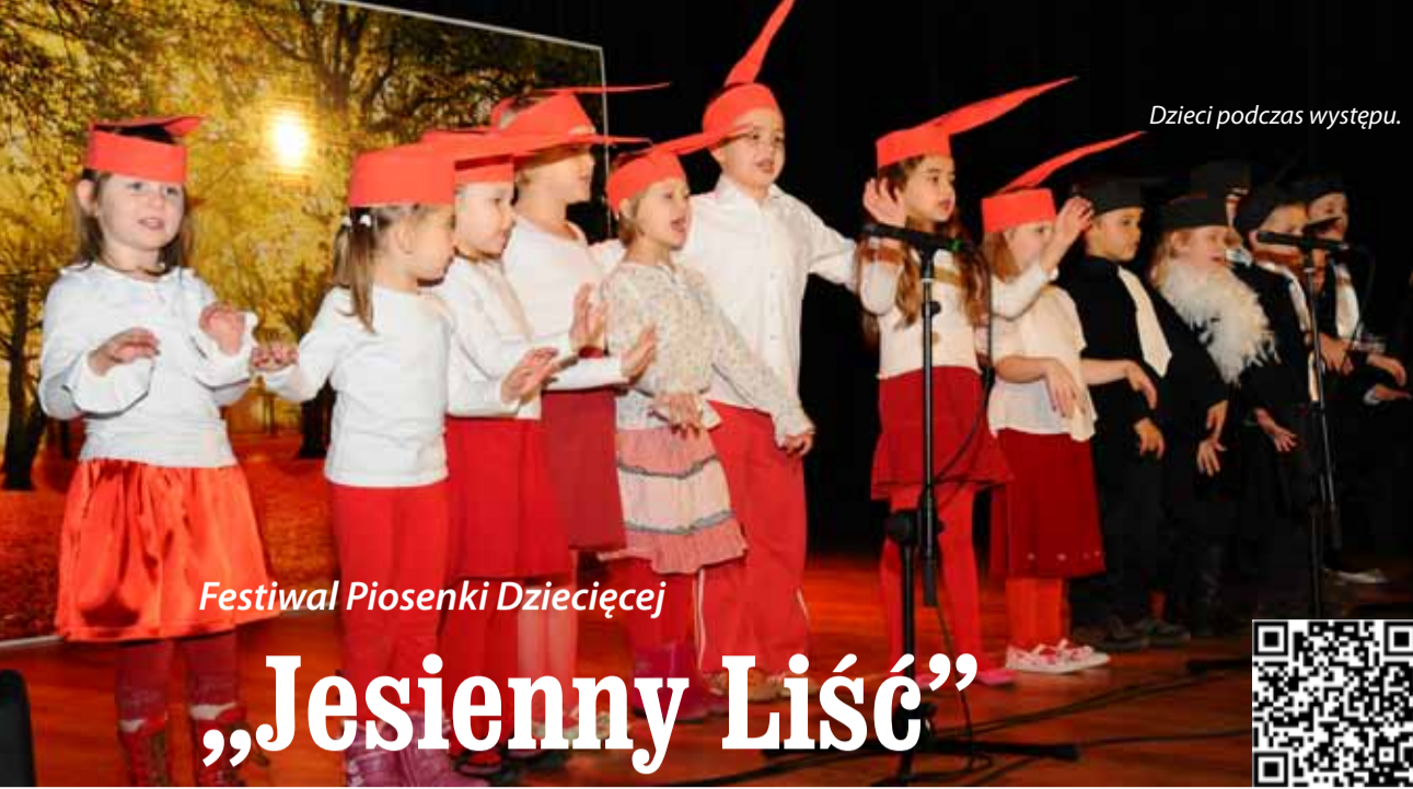
Dzieci podczas występu.