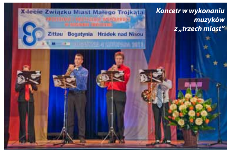
Koncert w wykonaniu muzyków z „trzech miast”