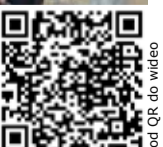
Kod QR do wideo