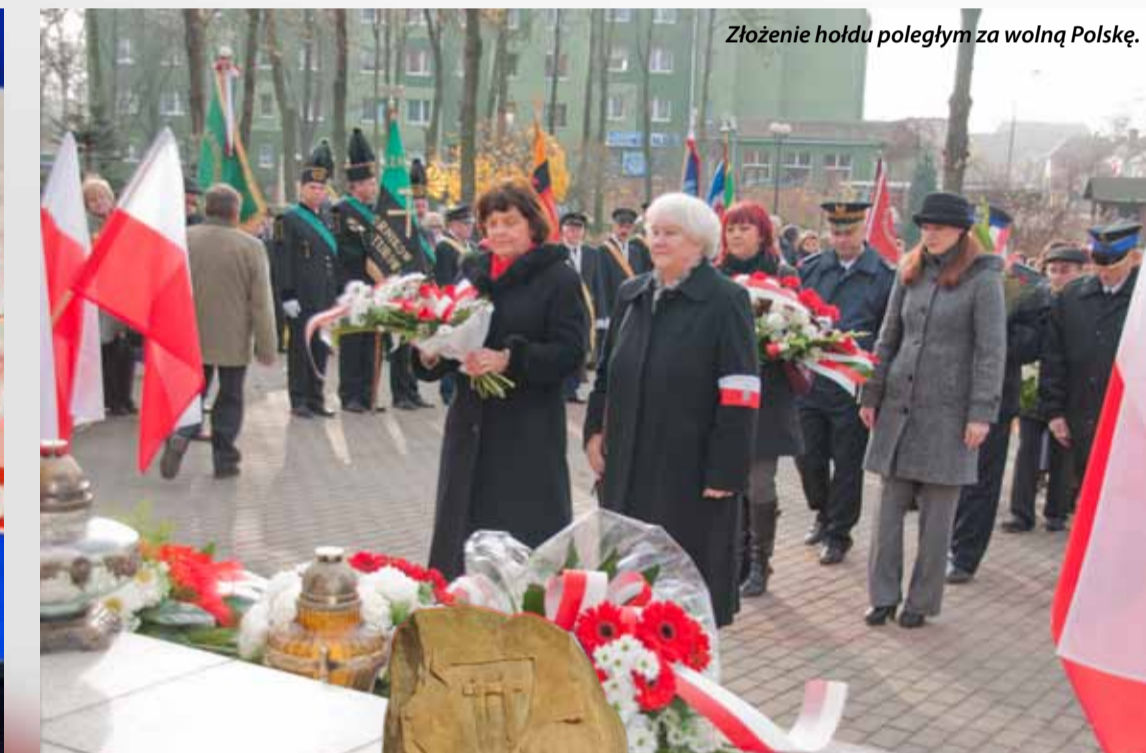
Złożenie hołdu poległym za wolną Polskę.