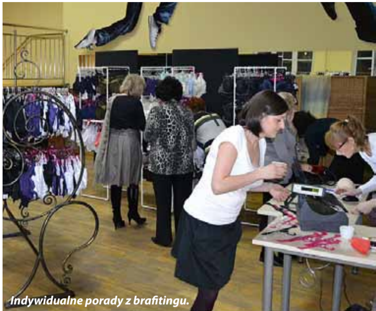
Indywidualne porady z brafitingu.