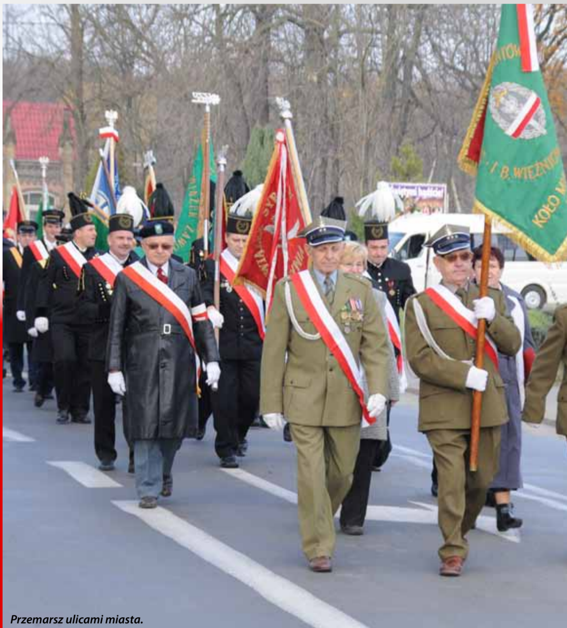
Przemarsz ulicami miasta.