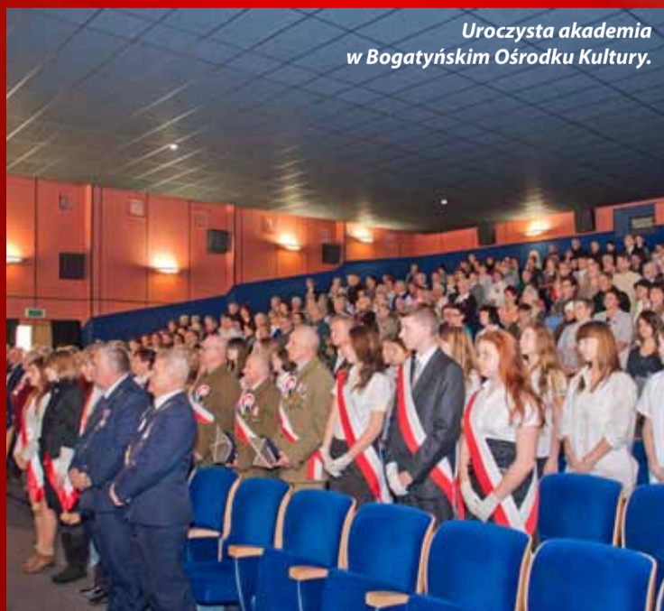
Uroczysta akademia w Bogatyńskim Ośrodku Kultury.