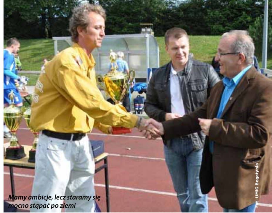
Mamy ambicje, lecz staramy się mocno stąpać po ziemi

niejach zajmując dwa razy I miejsce i raz II.