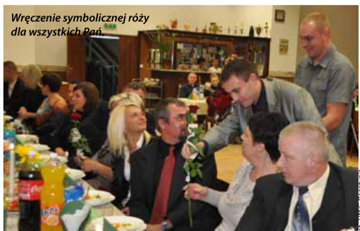
Wręczenie symbolicznej róży dla wszystkich Pań