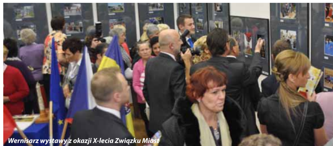
Wernisarz wystawy z okazji X-lecia Związku Miast