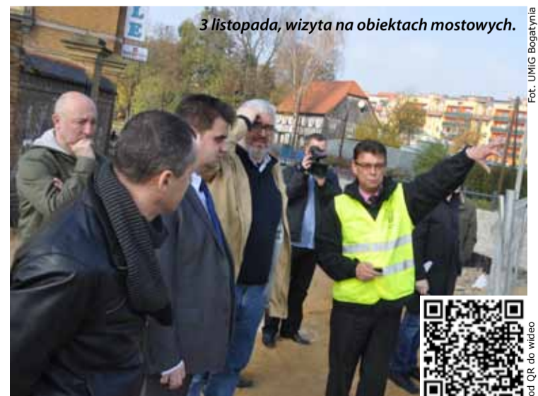
3 listopada, wizyta na obiektach mostowych.

Relację wideo z pierwszej wizyty wojewody można obejrzeć na stronie internetowej www.bogatynia.pl lub w telefonach komórkowych (kod QR).