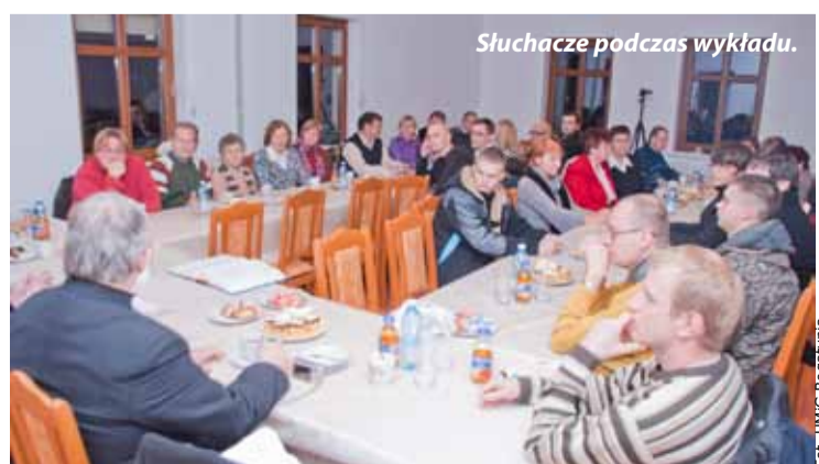
Sluchacze podczas wykładu.

Wieczorne spotkanie poprzedziła msza święta, po której zebrani udali się do świetlicy przy kościele na wykład pt. Najtrud-