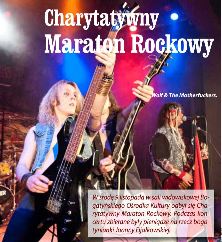
Wolf & The Motherfuckers.