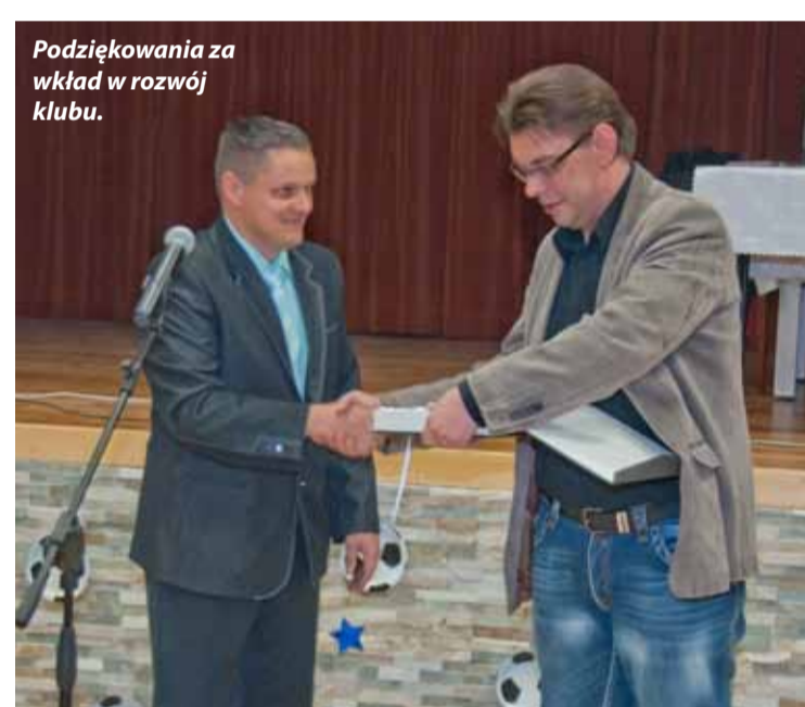
Podziękowania za wkład w rozwój klubu.