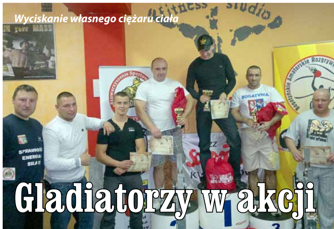
Wyciskanie własnego ciężaru ciała