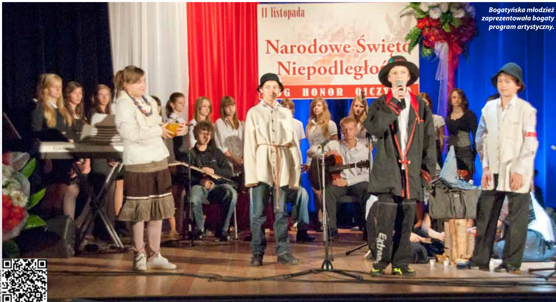
Bogatyńska młodzież zaprezentowała bogaty program artystyczny.