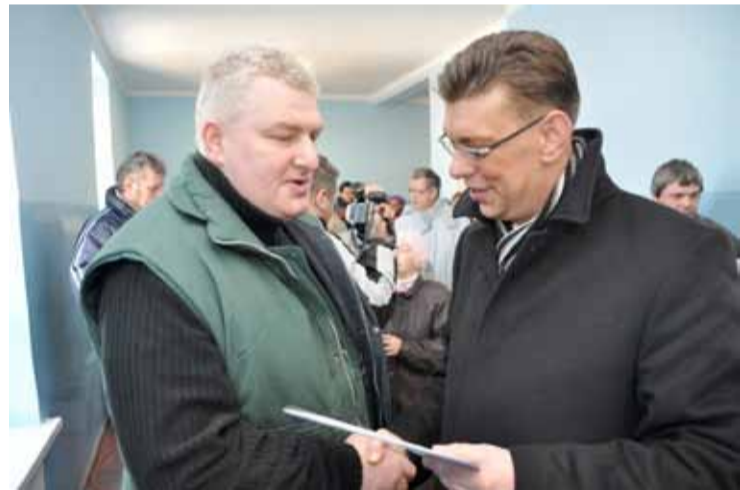
Przekazanie kluczy do nowego mieszkania.

dzać mieszkania po swojemu. Jak powiedział burmistrz Andrzej Grzmielewicz – nie ma dnia aby w urzędzie nie rozmawiano na temat powodzian i ich potrzeb, wszystkich poszkodowanych obejmujemy szczególną troską i zrobimy wszystko aby jak najszybciej zapewnić na-