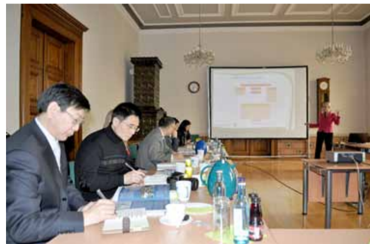
Konferencja „Wschodnio - zachodni transfer wiedzy” w Zittau.

Udział w konferencji chińskiej delegacji to kolejny element trwającej od 6 – 26 listopada podróży po Belgii i Niemczech. Chińczycy odwiedzili m. in. Berlin, Poczdam, Drezno i Gorlitz.