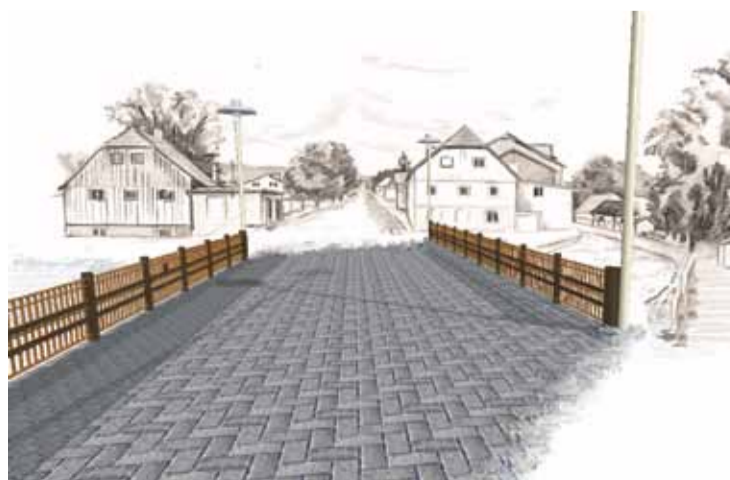
Mosty zniszczone podczas sierpniowej powodzi oraz projekty odbudowy.

Projekty autorstwa mgr inż. arch. Filipa Kasprzaka