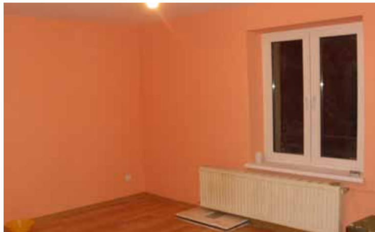
Jedno z wyremontowanych mieszkań przy ul. Robotniczej 7.

wana jest w prace pomocnicze przy rozładunku i transporcie darów dla powodzian. Pracownicy są odpowiedzialni między innymi za transport i dostarczanie sprzętu AGD oraz materiałów budowlanych, które darczyńcy sukcesywnie przekazują do magazynów powodziowych.