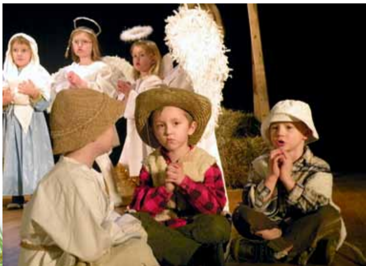
Ubiegłoroczny Przeгляд Widowisk Jasełkowych.