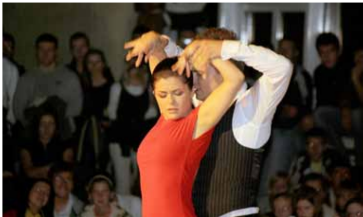
Katarzyna Cichopek i Marcin Hakiel.