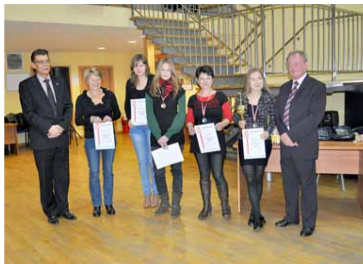
Uhonorowani członkowie klubu.