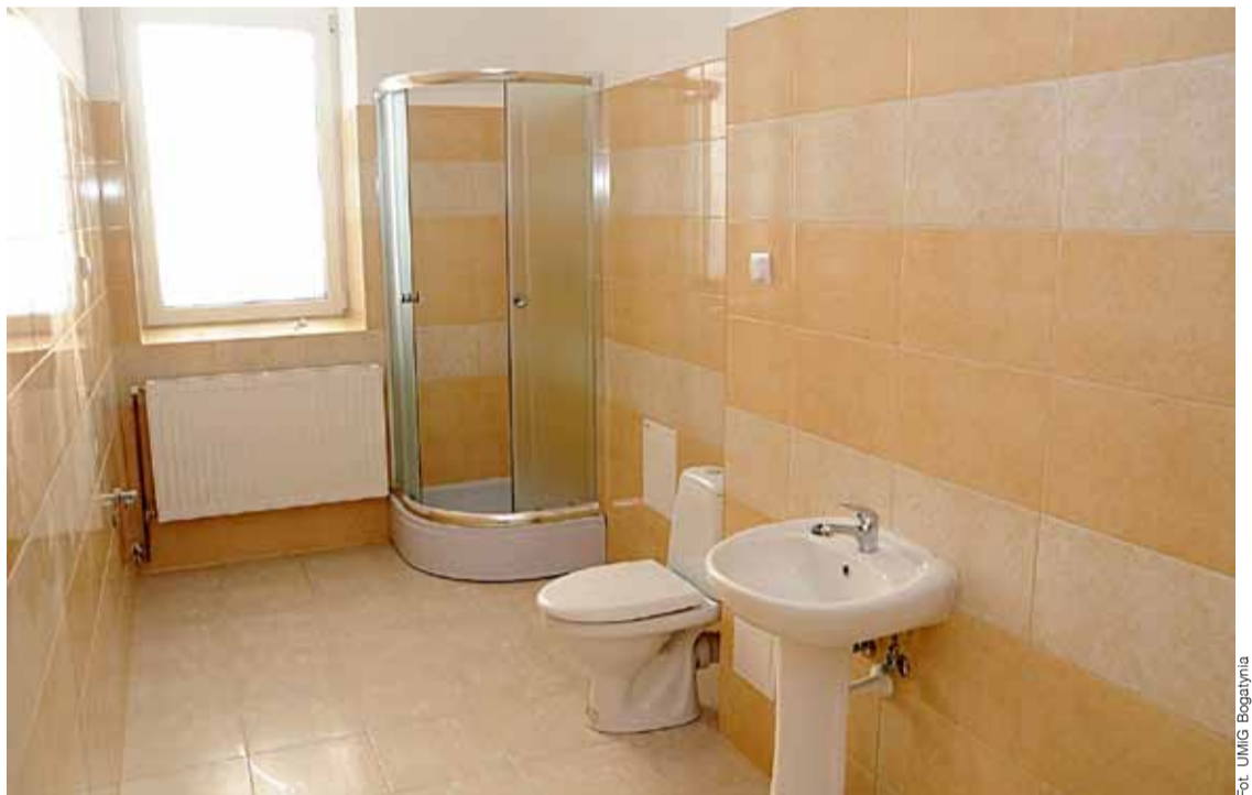
Łazienka w jednym z oddanych mieszkań.