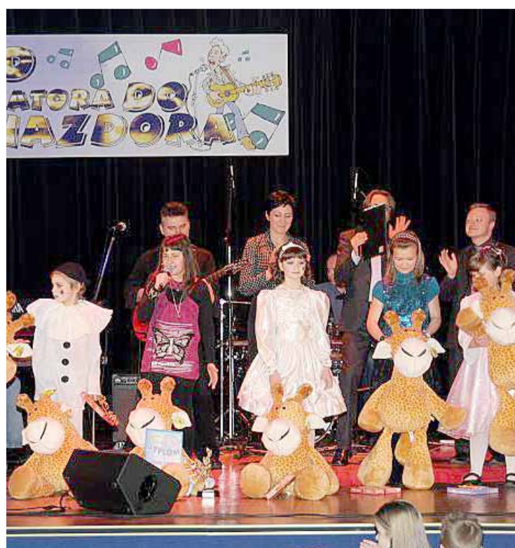
Finał konkursu piosenki „Od Amatora do Gwiazdora”.