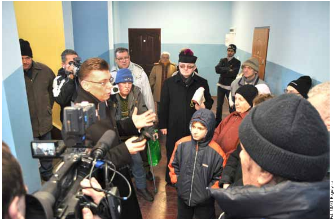
Spotkanie z mieszkańcami.

Wszystkich zaskoczył efekt wykonanych prac. W tej chwili lokatorzy mogą urzą-