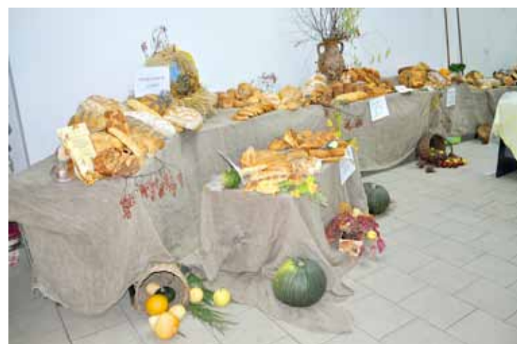
„Święto chleba” w Działoszynie.

ży Pożarnej, gdzie ksiądz proboszcz dokonał poświęcenia prezentowanych wypieków, które przygotowały zaprzyjaźnione piekarnie, od Bogatyni aż po Lubań Śląski. Koło Gospodyń Wiejskich w Działoszynie zadbało o odpowiednie dodatki do chleba. I tak można się było raczyć swojskim smalcem, miodem, ciastem czy powidłami. Wśród uczestników święta nie zabrakło przedstawicieli władz samorządowych, Kół Gospodyń Wiejskich z naszej gminy oraz zaprzyjaźnionych gości.