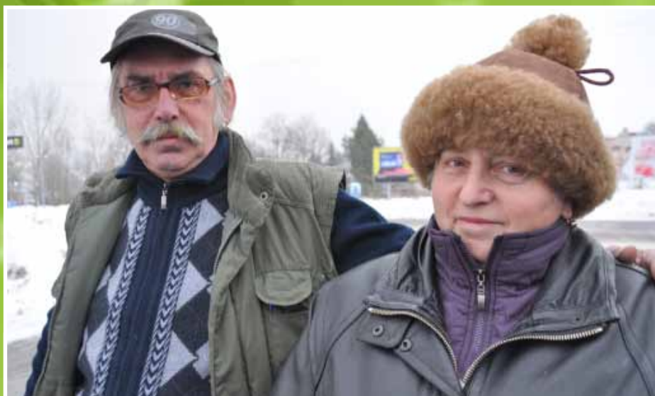
Najlepsze świąteczne i noworoczne życzenia dla całej rodziny Stulińskich i Iwanowskich oraz dla wszystkich mieszkańców Bogatyni.