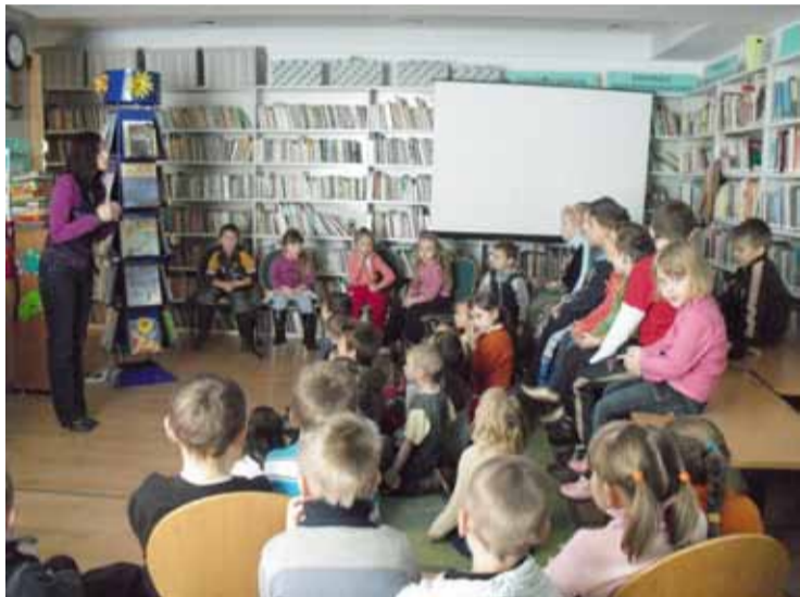
Andrzejki dla przedszkolaków.

sprawiły dzieciom ogromną radość. Z uśmiechem na ustach przedszkolaki odkrywały swoje przyszłe zawody, rzuciły grosik na szczęście do wody oraz obserwowały, jak z wosku tworzą się magiczne kształty. Najwięcej radości sprawiły maluchom tańce przy muzyce. Spotkanie zakończyło się w miłej atmosferze. Każde dziecko otrzymało pamiątkową zakładkę do książki oraz słodycze.