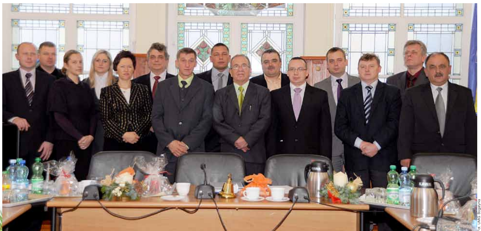
Trzecia, przedświąteczna sesja.