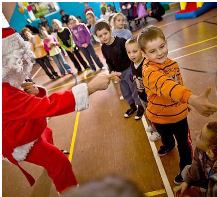
Mikołajki na sportowo.